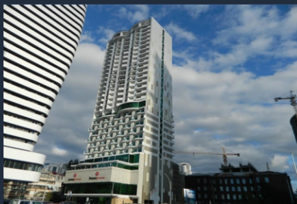
Г. Батуми Ул. Горгиладзе 120