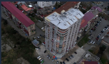
Г. Батуми ул. Джавахишвили 6а