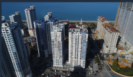
Г. Батуми Ул. Пиросмани 18