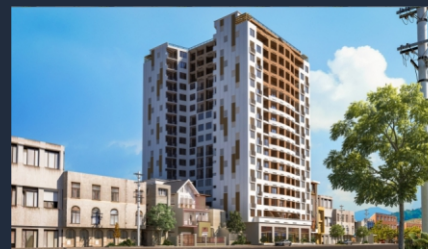
Г. Батуми ул. В. Пшавела 53/55

Тел. : +995 514 67 47 47 +995 514 65 47 47