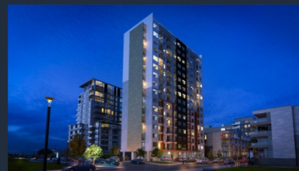
Г. Тбилиси ул. Багдади