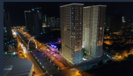
Г. Батуми ул. Ж. Шартава 16